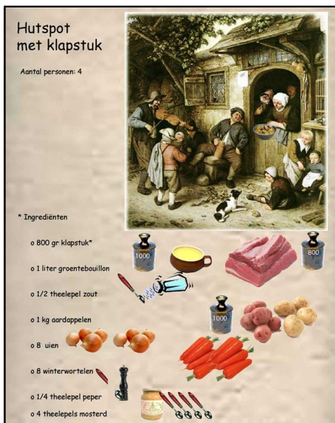
Hutspot met klapstuk.

Vrijwel iedereen kent de combinatie van het woordgebruik 'hutspot met klapstuk'. Maar als je vraagt wat klapstuk nu eigenlijk is, blijft het stil. Klapstuk is een met dunne draden vet doorregen stuk rundvlees van de klaprib. Klapstuk moet vrij lang stoven en wordt daarom door sommigen ook wel stoofvlees genoemd. Het is een bijzonder smakelijk stukje vlees!