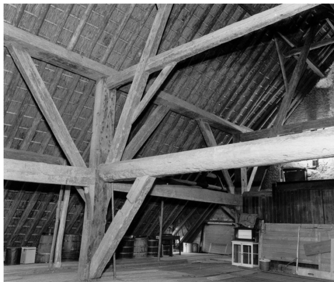
Een willekeurige zolder van een willekeurige boerderij.

Het hout werd aangevoerd over de Rijn. Dat gebeurde met hele grote houtvloten, waarvan ook de vervoerde houten stammen zelf deel uitmaakten. Die vloten werden via de Waal over de Merwede geloodst. Bij Dordrecht aangekomen werden ze ontkoppeld en vervolgens opgeslagen in de Biesbosch, totdat een van de vele houtzaagmolens die Dordrecht vroeger rijk was, ze tot de gewenste proporties had gezaagd als ankerbalk, strijkbalk of korbeel, om maar enkele voorbeelden te noemen. De vlotvaart op de Rijn en zijrivieren heeft ruim 600 jaar bestaan. Een interessante geschiedenis, die bijna niemand kent.