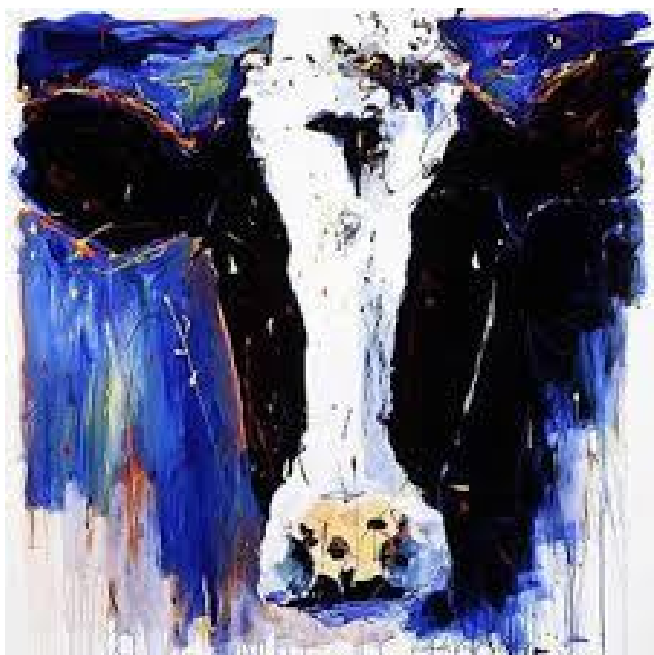
Een driejarige koe, volgens internet; schilder onbekend.

Een schot is een niet dragende afscheiding van (oorspronkelijk) hout. Een afscheiding van houten delen. Een bouwkeet wordt gemaakt van houten schotten en een tuinschutting maakt men van tuinschotten. Een hoekje in de tuin wordt beschot om er wat beschermt tegen de wind te kunnen zitten.