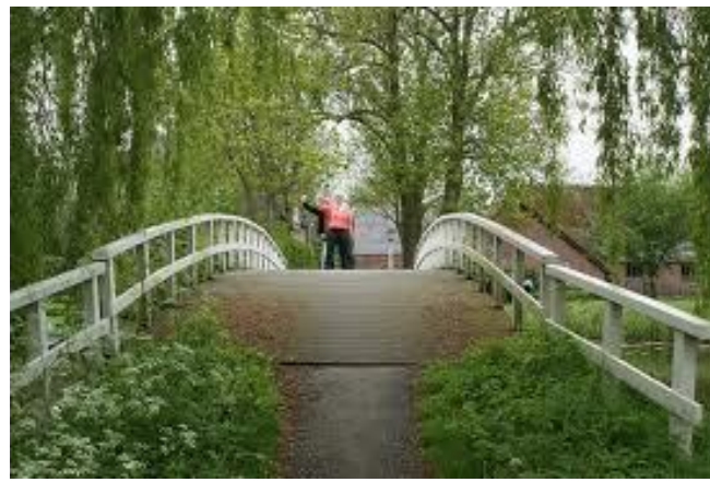
De Pinkeveerse brug in Giessenburg.

We keren nog even terug naar de jonge koe. Kenmerkend voor deze koeien was / is dat ze in een afgescheiden deel van de stal vrij kunnen rondlopen en nog niet op een vaste plaats gestald staan voor de voergoot of ruif. Al eerder is vermeld waar de benaming schot vandaan komt. Een andere uitleg is wat vergezocht. De naam zou komen van het heen en weer schieten van de jonge koe in de betekenis van het (plotseling) vrijelijk gaan bewegen. Om te voorkomen dat de dieren zich te ver bewegen, wordt er een schot gemaakt, zodat ze afgeschoten blijven van de rest van het vee.