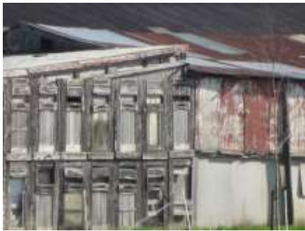
Niet alleen van schotten, maar ook van deuren en golfplaten maakte men wel schuren.

Een andere naam voor een jonge koe is pink of vaars. Vaars heeft ook een tweeledige betekenis, net als schot. Het is een tweejarige koe, die nog niet heeft gekalfd. Maar ook de naam wordt ook wel gebruikt voor een koe die voor de eerste maal heeft gekalfd. Vreemd genoemd komt het woord vaars van var, een benaming die in de middeleeuwen aan jonge stieren werd gegeven. De naam pink spreekt veel meer tot de verbeelding. Daarmee bedoelt men een eenjarig kalf, dat nog alle melktanden heeft. Dergelijk jongvee werd in onze buurt vroeger heel vaak verhandeld op de Gorcumse veemarkt, die elke maandag plaatsvond. Uit de hele omgeving werd dat jongvee aangevoerd. Alles wat van boven (ten noorden) van de Giessen kwam werd bij Pinkeveer (Giessenburg) overgevaren. Later kwam er de Pinkeveersebrug, een tolbrug, waar per overgebrachte pink (en begeleider) moest worden betaald.