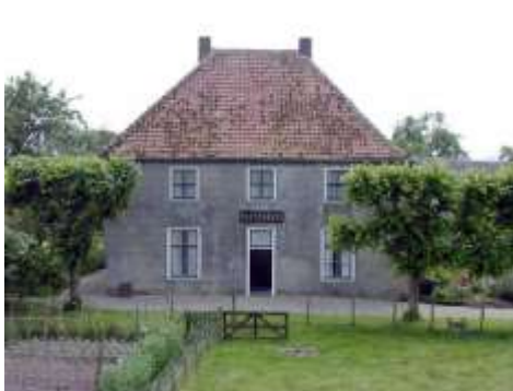
boerderij & erf alblasserwaard-vijfheerenlanden

De Werkgroep Boerenerven heeft in het Streekcentrum Het Liesvelt een expositie ingericht rondom de namen van boerderijen en andere landelijke gebouwen. De werkgroep verzorgt het paviljoen van Boerderij & Erf Alblasserwaard- Vijfheerenlanden en komt jaarlijks met een interessant thema. Dit jaar is de keuze gevallen op de namen van boerderijen en de herkomst ervan. Daarnaast is er ook het model van de ontginningsboerderij van Meine Mollema te zien.