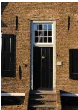
Koperen sierknop op de deur.

Toen mij werd gevraagd over de expositie in Het Liesvelt een kort persbericht te schrijven, realiseerde ik me dat dit een belangrijk onderwerp is. En tegelijkertijd een miskend onderwerp. Want bijna altijd vertelt de naam van een boerderij – of een ander op het platteland voorkomend gebouw – iets over de geschiedenis ervan. De naam kan zijn ontleent aan iets in de omgeving, een oude veldnaam bijvoorbeeld. Of aan een persoon, de bouwer of een latere eigenaar. Of aan iets heel anders, wat pas logisch wordt als de reden van die naam bekend is geworden. Naamgeving is een boeiende materie. Sinds lange tijd heb ik zitting in de Straatnamencommissie van de Gemeente Hardinxveld-Giessendam. Toen ik jaren terug daarin werd benoemd was er een denktank nodig, om nieuwe straten van namen te voorzien, wat op een verantwoorde wijze moest gebeuren. Laten we eerlijk zijn: niemand vindt het leuk om te moeten melden dat hij aan de Pispotsteeg woont. En dat is nog maar één voorbeeld van wat niet moet. Andere aspecten zijn de schrijfwijze van een naam, de schrijflengte en de vindbaarheid, zoals de ligging in een wijk met gelijksoortige namen. En met wat verbeelding is daar nog een heel areaal aan toe te voegen van elementen die in gedachte moeten worden gehouden bij het bedenken van nieuwe straatnamen.