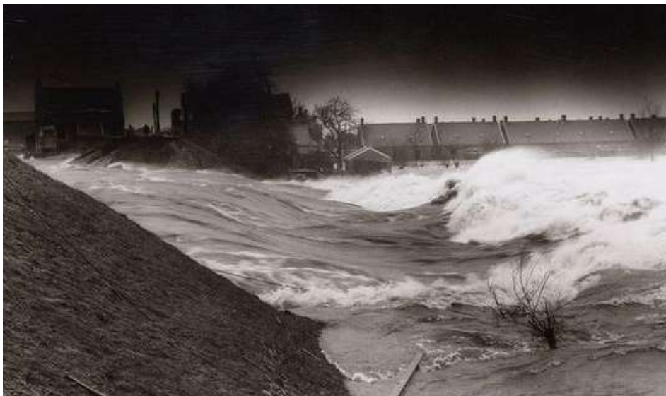
De dijkdoorbraak bij Papendrecht, die in 1953 veroorzaakte dat de weilanden achter De Koperen Knop onder water liepen.

Die staatsiedeur werd niet gebruikt en is dan ook niet van buiten af te openen. Vandaar de naam staatsiedeur. Feitelijk was het een waterdeur. Binnen in de waterboerderij is het voorhuis zo'n tachtig centimeter hoger gesitueerd dan de rest van de boerderij. Daardoor kon men er bij een eenvoudige overstroming gewoon blijven wonen. Maar als het moest, wanneer het water hoger kwam dan de vloer van het voorhuis, kon men via die deur in een bootje stappen en zich in veiligheid brengen.