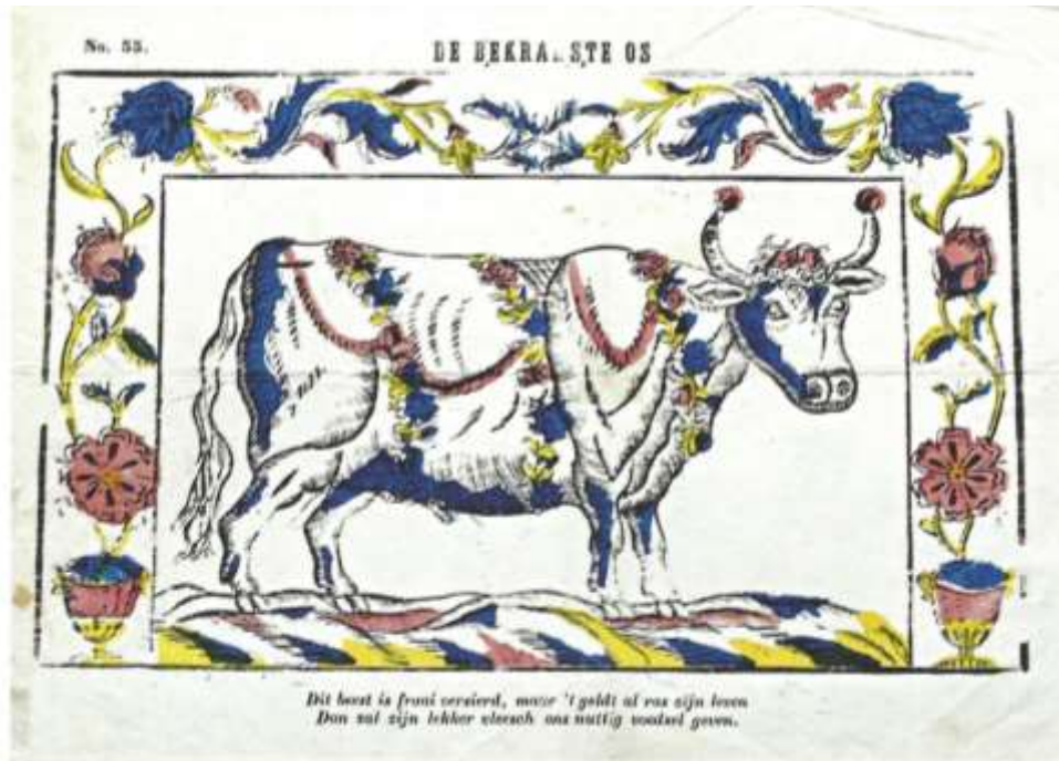
Eeuwenlang waren ze niet weg te denken uit de Nederlandse samenleving. Ze behoren tot de populaire grafiek: gedrukt in een hoge oplage en verkrijgbaar voor

hebben diezelfde functie. Ergens een verbeelding bij geven. Eigenlijk zijn volksprenten deel van een viertal: kinderprenten, volksprenten, centsprenten en schoolprenten. Het onderscheid werd aangegeven door het eerste woorddeel: bestemd voor kinderen, bedoeld voor het gewone volk (dat geen schilderijen kon betalen), te koop voor een cent en gebruikt op school. De meest gebruikte benaming is nog altijd kinder- en volksprenten.