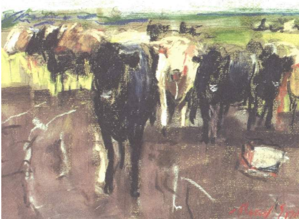
Een pracht prent uit het Koeienschetsboek van beeldend kunstenaar Ruud Spil.