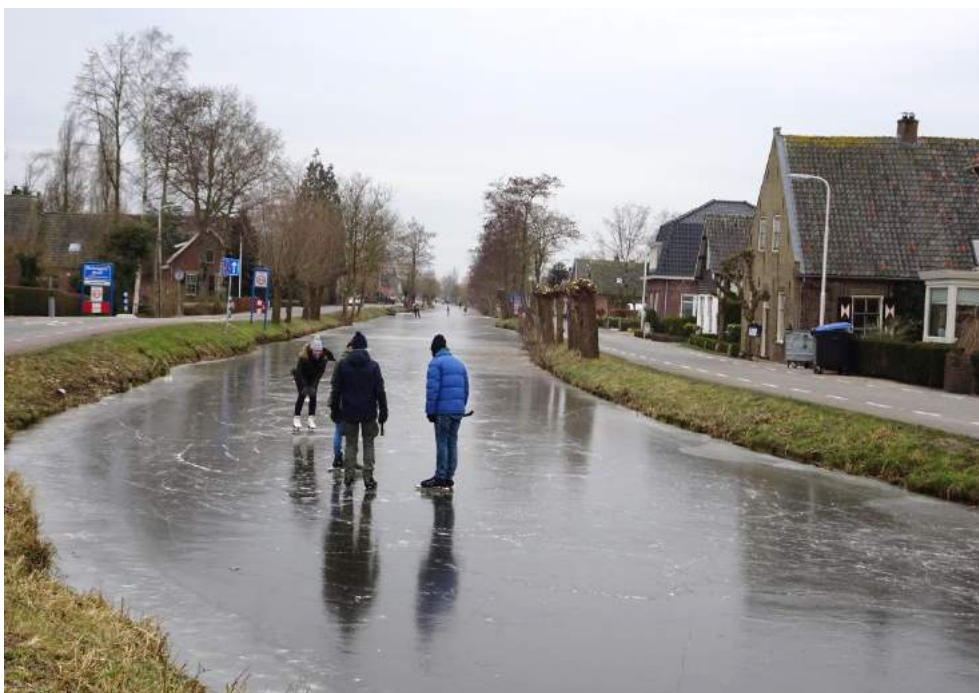
Het was weer – heel even – mogelijk deze winter.

Met de meeste hoogachting en vriendelijk groetend, Federatie van Particuliere Monumenteneigenaren (FPM): Vereniging Bewoond Bewaard Vereniging Particuliere Historische Buitenplaatsen Stichting Agrarisch Erfgoed Nederland