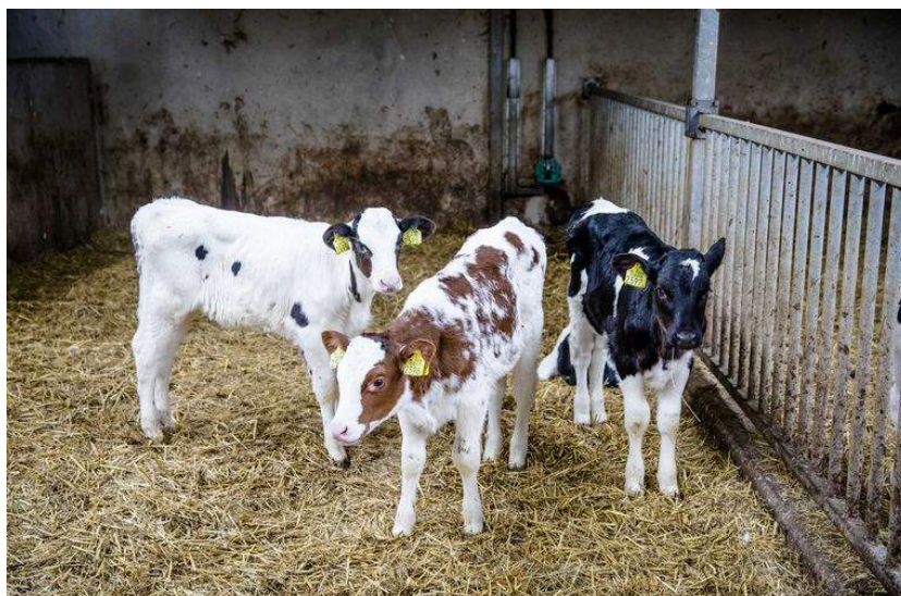
Kalfjes op stal bij een melkveehouder in Reeuwijk.

Het aantal koeien per boerderij neemt in Nederland al jaren toe. Bij gebrek aan genoeg eigen grond moeten boeren steeds meer mest afvoeren en voer inkopen, bijvoorbeeld soja uit Zuid-Amerika. Deze intensieve werkwijze heeft negatieve